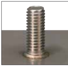
Kleiner, gleichmäßiger spritzerfreier Schweißwulst