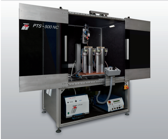
PTS-500 NC – Die einfache Lösung vom Handgerät zur vollautomatischen Bolzenschweißanlage