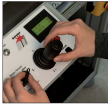
Teach-In Bedienung Teach-In operation