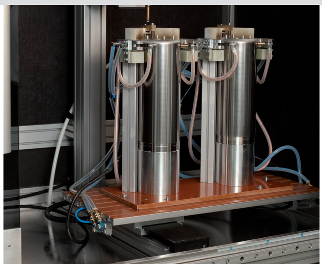
PTS-500 NC – A simple step.....From hand units to fully automated stud welding systems